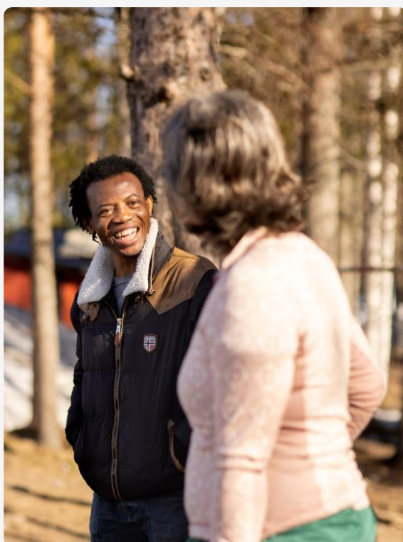
© Terry Mordi från Nigeria trivs på utflykt. Foto: Malin Grönborg