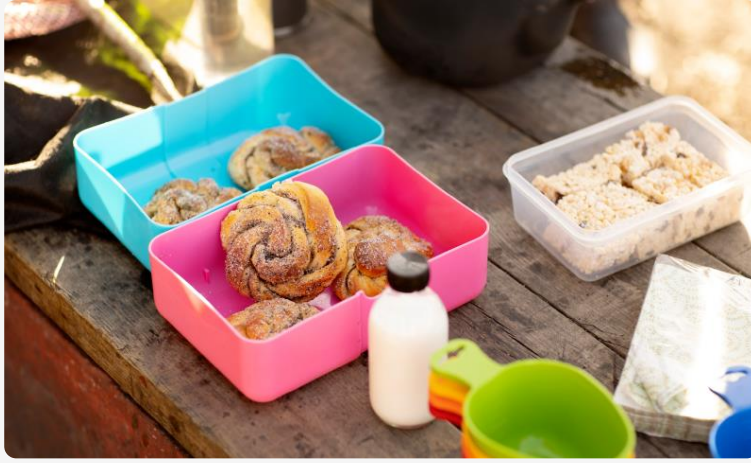
Fikat är viktigt vid Vän i Umeås träffar.